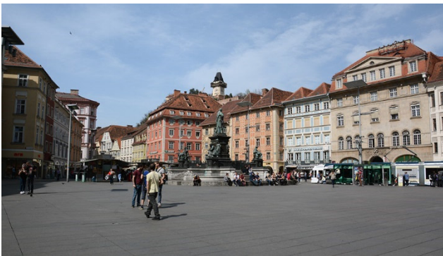
Die charmante Stadt Graz

Österreich hat sowohl landschaftlich als auch kulinarisch und kulturell enorm viel zu bieten. Auf dieser Agrarreise statten wir dem Grünen Herz Österreichs; der Steiermark einen Besuch ab. Landwirtschaft, Genuss und Gemütlichkeit stehen hier im Mittelpunkt.