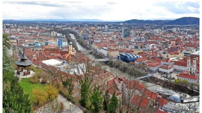
mit ihren vielen Sehenswürdigkeiten