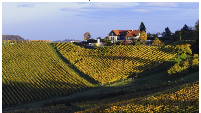
Unterwegs auf der Südsteirischen Weinstrasse