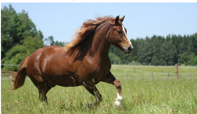
Die letzte ursprüngliche Schweizer Pferde-Rasse; der Freiburger