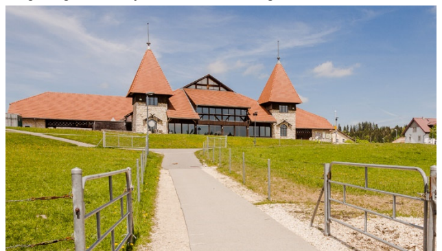
Das Pferdezentrum in Saignelégier