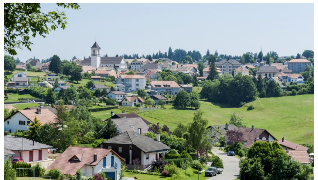
Saignelégier in den jurassischen Freiberge