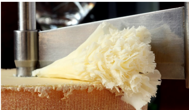
Tête de Moine in Bellelay

Der Pferdemarkt von Saignelégier mit seinem Pferdewettbewerb wurde zu Beginn des 20. Jahrhunderts mit der Absicht gegründet, die einheimische Rasse der Freiburger Pferde bekanntzumachen und zu fördern. Einst mit einem wichtigen Tiermarkt gekoppelt, wurde die Veranstaltung nach und nach zu einem Pferdefest. Erleben Sie mit uns dieses Schauspiel und geniessen Sie zwei Tage im Jura.