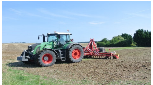
Bodenbearbeitung nach der Ernte