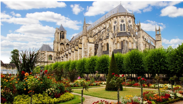
Kathedrale St. Etienne in Bourges mit schönem Garten

Kaum eine Region hat die französische Geschichte derart stark beeinflusst. Könige und Königinnen, Minnesänger, Hofnarren und Mätressen belebten das Loiretal und regierten Frankreich. Hier wurde gefeiert und in vollen Zügen genossen. Gerne möchten wir Ihnen auf dieser Kurzreise einen Eindruck dieser Region geben. Bei einem Besuch einer Pilzzucht in einem mächtigen Tuffsteinkeller und auf einer Schiffstour lernen Sie die Landschaft besser kennen. Sie besichtigen einen Ackerbaubetrieb einer Schaffhauser Familie. Frankreich zählt zu den bedeutendsten Produzenten landwirtschaftlicher Erzeugnisse in Europa und ist auch weltweit der zweitgrösste Exporteur von Agrarprodukten. Die landwirtschaftliche Gesamtnutzfläche Frankreichs nimmt mit rund 33 Milliarden Hektar fast 60% der gesamten Landesfläche ein. Einen grossflächigen Anbau von Getreide gibt es vor allem im Raum zwischen dem Pariserbecken und Zentralfrankreich.