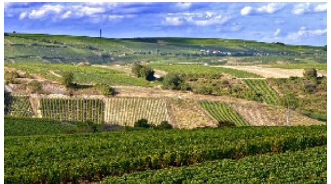
Rebbergen von Sancerre