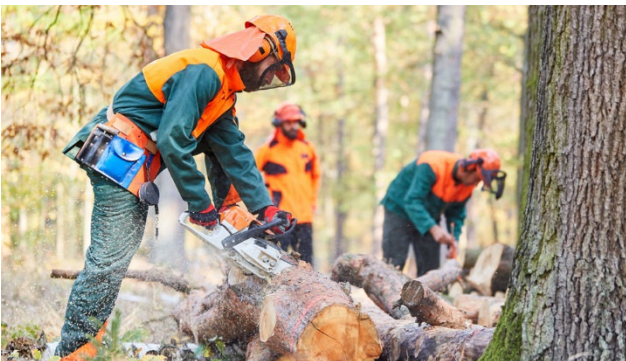
Erleben Sie zwei spannende Tage an der

Erleben Sie mit uns die KWF Expo – die weltgrösste Forst-Demo-Messe in Schwarzenborn. Auf einer 100 Hektar grossen Feld- und Waldfläche präsentieren über 500 Aussteller aus über 25 Ländern ihre neuesten Entwicklungen und den umfassenden Stand der Technik.