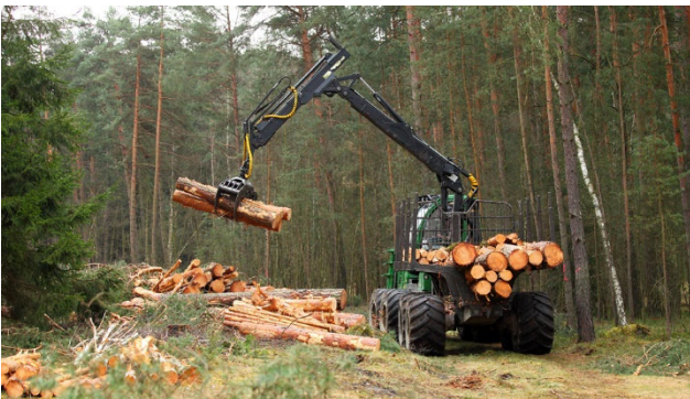
in Schwarzenborn Hessen.