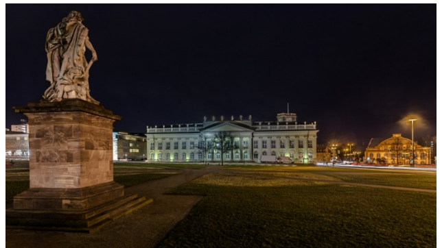
Kassel Ihr Übernachtungsort