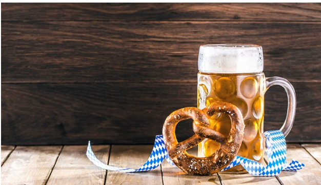
...für Forstwirtschaft und Forsttechnik...