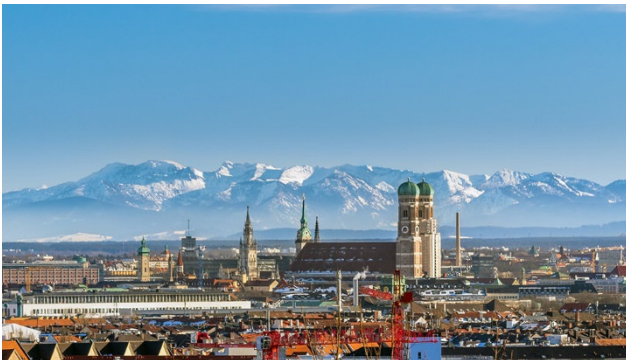
Kommen Sie mit...

Als internationale Fachmesse und Innovationsplattform für Forstwirtschaft und Forsttechnik, zeichnet sich die Interforst in München durch ihren kompakten und repräsentativen Marktüberblick aus. Das Produktangebot und das facettenreiche Rahmenprogramm aus Wirtschaft, Wissenschaft und Politik fokussiert die gesamte forstwirtschaftliche Wertschöpfungskette und sorgt für Wissenstransfer, effektives Networking und konkrete Geschäftsabschlüsse. Die Interforst agiert mit Sachverstand, Leidenschaft und sicherem Trendgespür und ist ihren Kunden verlässlicher Partner und herzlicher Gastgeber zugleich.