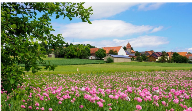
Mohnfeld in Blüte