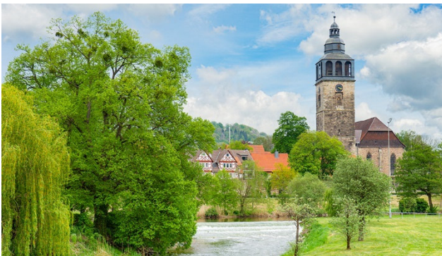
Ihr Aufenthaltsort die schöne Fachwerkstadt....

Der Werra-Meißner-Kreis ist das politische Gebilde im Geo-Naturpark Frau Holle Land im Werratal, der Heimat der Gebrüder Grimm. In Hessen «ganz oben gelegen», gehört diese Region zu den landschaftlich reizvollsten Regionen, die man in der Mitte Deutschlands finden kann. Natürliche Schönheit und Harmonie prägen die alte Kulturlandschaft an Werra und Meißner mit ihren attraktiven Fachwerkstädten und –dörfern, in denen man sich einfach sehr wohl fühlt. Kommen Sie mit auf eine spannende Reise in der die Landwirtschaft, die Region mit ihren Leuten und das Kulinarische an erster Stelle stehen.