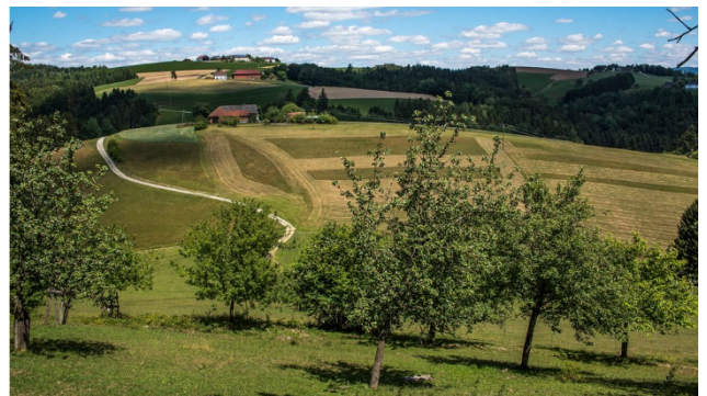
Landschaft im Mühlviertel