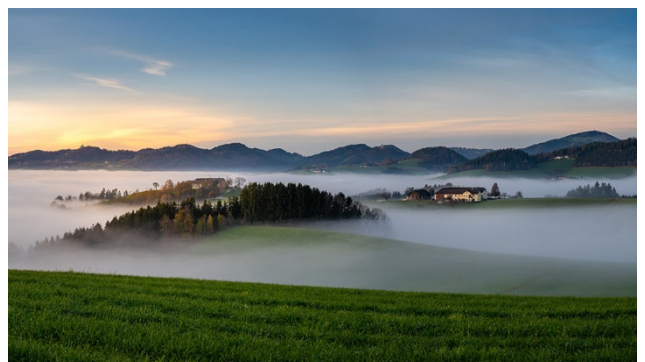
Mystische Stimmung im Mühlviertel