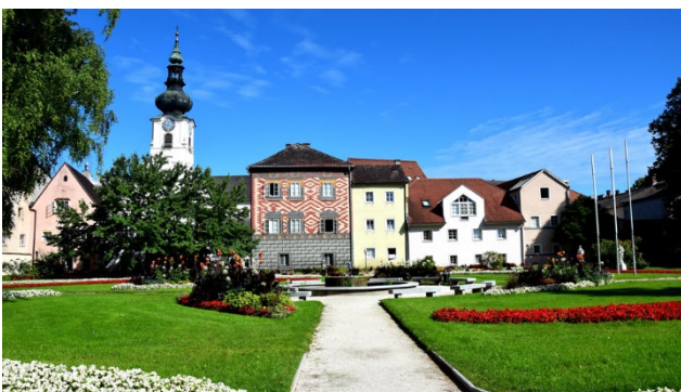
Stadt Wels mit dem Burggarten