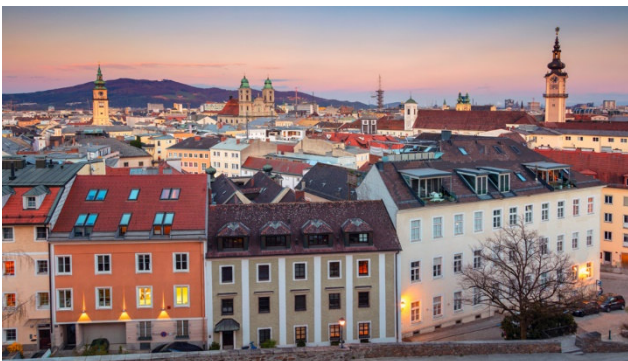
Die Stadt Linz an der schönen Donau

Mit seinem Charme und abwechslungsreichen Charakter lockt Oberösterreich. Eingebettet inmitten sanfter Hügel und saftigen Obsthaine befindet sich die Stadt Wels, welche mit ihrer historischen Altstadt zu begeistern weiss. Die zentrale Lage der Stadt bietet sich für diese Agrarreise perfekt an. Sie erkunden an einem Tag das Mühlviertel, welches zwischen Donau und dem Böhmer Wald im Norden liegt. Dort besuchen Sie zwei landwirtschaftliche Betriebe. Erkunden Sie auf dem Ausflug an die Donau die prachvolle Stadt Linz.