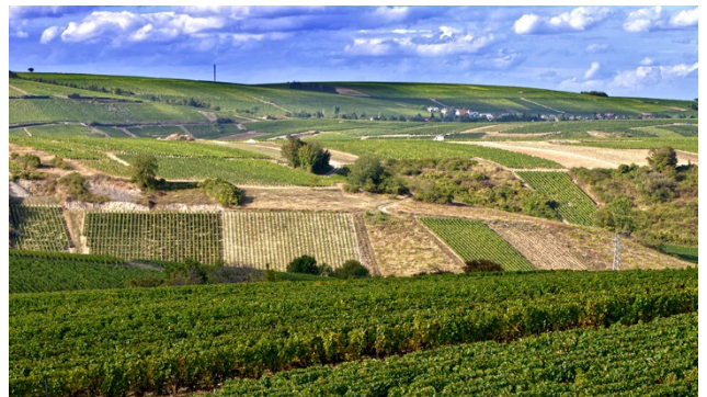
Rebbergen von Sancerre