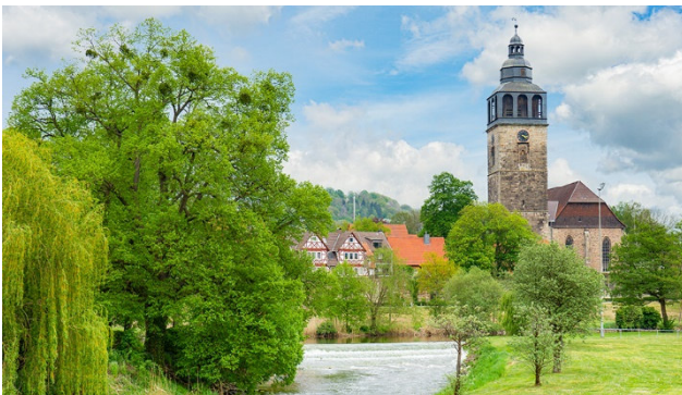
Ihr Aufenthaltsort die schöne Fachwerkstadt....

Der Werra-Meißner-Kreis ist das politische Gebilde im Geo-Naturpark Frau Holle Land im Werratal, der Heimat der Gebrüder Grimm. In Hessen «ganz oben gelegen», gehört diese Region zu den landschaftlich reizvollsten Regionen, die man in der Mitte Deutschlands finden kann. Natürliche Schönheit und Harmonie prägen die alte Kulturlandschaft an Werra und Meißner mit ihren attraktiven Fachwerkstädten und –dörfern, in denen man sich einfach sehr wohl fühlt. Kommen Sie mit auf eine spannende Reise bei der die Landwirtschaft, die Region mit ihren Leuten und das Kulinarische an erster Stelle stehen.