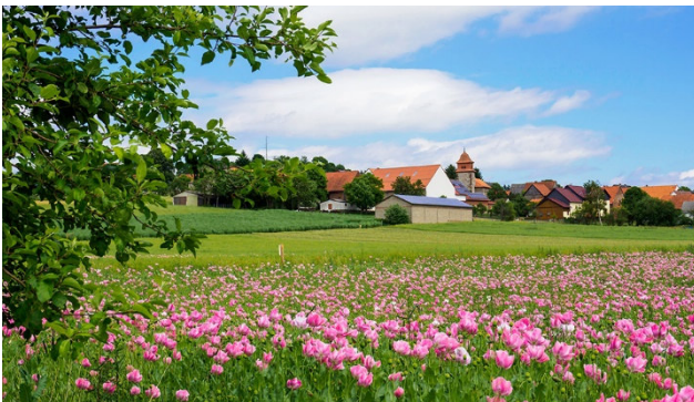
Mohnfeld in Blüte