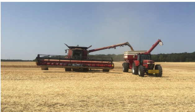
Während der Ernte in der Kornkammer Europas