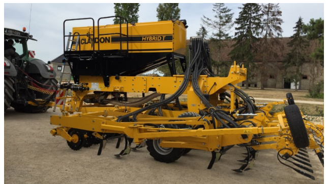
Sähmaschine neuester Generation